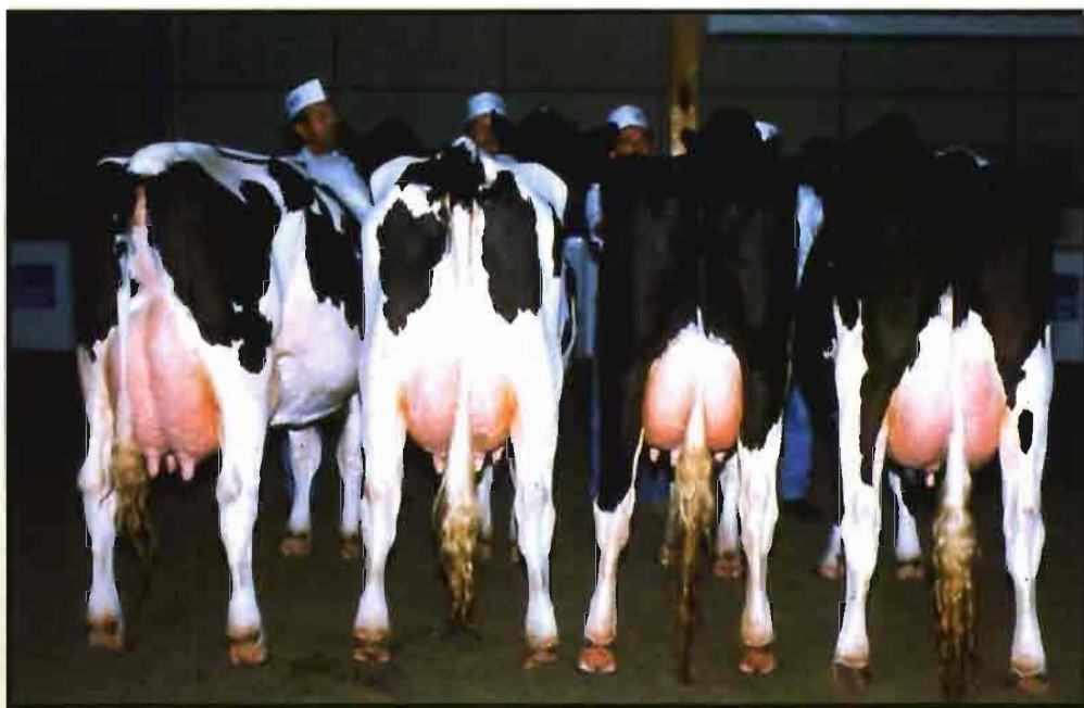
En mejora genética habría que aunar esfuerzos entre las cuatro CC.AA. de la España húmeda.

Es evidente estos últimos años que las compañías más prestigiosas y avanzadas en el mercado mundial, al igual que las empresas de cualquier sector económico, se asocian de alguna manera para agregar esfuerzos y trabajar con el objetivo de competir reduciendo costes y ganando eficiencia, en un tiempo en que la inter-