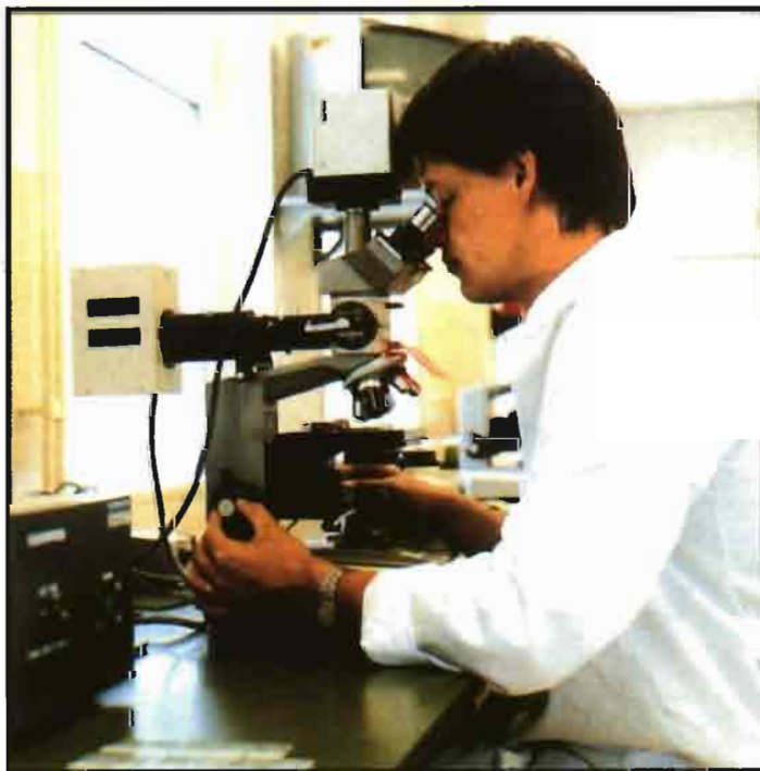
Los investigadores esperan la pronta detección de nuevos genes.

buye que al presente las empresas de prestigio comiencen a valerse de la tecnología de los marcadores genéticos antes de que los toros sean incorporados a las pruebas de descendencia, para incrementar previamente la seguridad de la selección. Todos y cada uno de los toros a prueba son sometidos a una batería de tests de marcadores genéticos; así la genética molecular es empleada en el proceso, dando lugar a la llamada selección asistida por marcadores, que detectará aquellos loci donde los polimorfismos manifiestan dife-