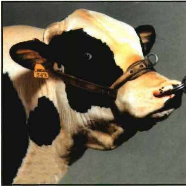
Numerosos países compiten en el testaje de toros.

en el testaje de toros de razas lecheras, sobre todo de raza Frisona, hoy Holstein-Friesian americana (origen EE.UU. y Canadá). El número aproximado de sementales en prueba cada año se recoge en el cuadro II .