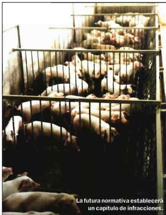
La futura normativa establecerá un capítulo de infracciones.

Cuando se trate de explotaciones pertenecientes o que van a pertenecer a ADS, y con el fin de facilitar la salida de