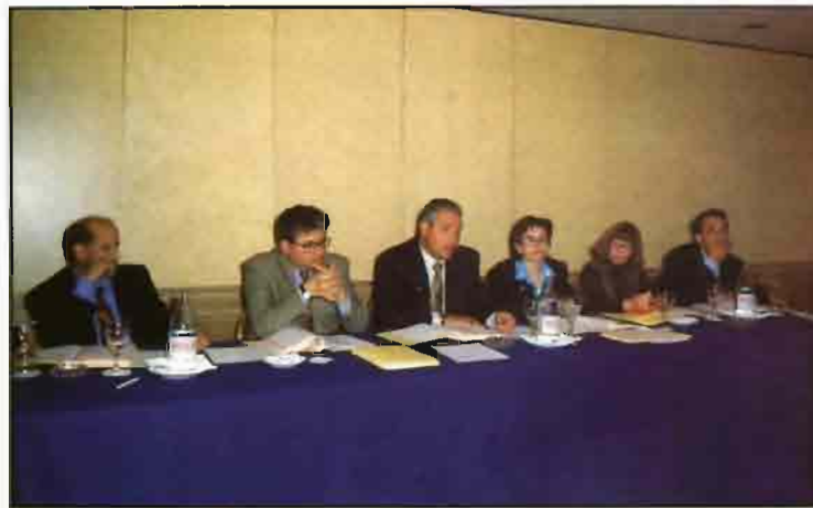
Junta Directiva de Aseprhu en su Asamblea General.

A seprhu ha iniciado 1998 cumpliendo el mandato de su Asamblea General de 1997: constituir la Asociación Interprofesional del Huevo y sus Productos. En enero se registraron los estatutos sociales de Inprovo, nombre de la Interprofesión, y en breve ésta presentará al Ministerio de Agricultura los documentos necesarios para su reconocimiento como Asociación Interprofesional Agroalimentaria.