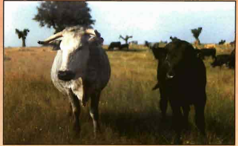
Los cruzamientos con ganado Holstein, con Cebú (foto izq.) o con otras razas autóctonas españolas, como la Morucha (foto dcha.) son objetivos de ACRUGA.

El sistema de producción de este ganado, en función de la ecología y de los condicionamientos socio-económicos del área geográfica, determina sobre canales dos características cuantitativas de gran importancia económica: el peso canal (210 kg) y su edad cronológica (205 días), de las que van a depender factores tan determinantes de la calidad como es la terneza.