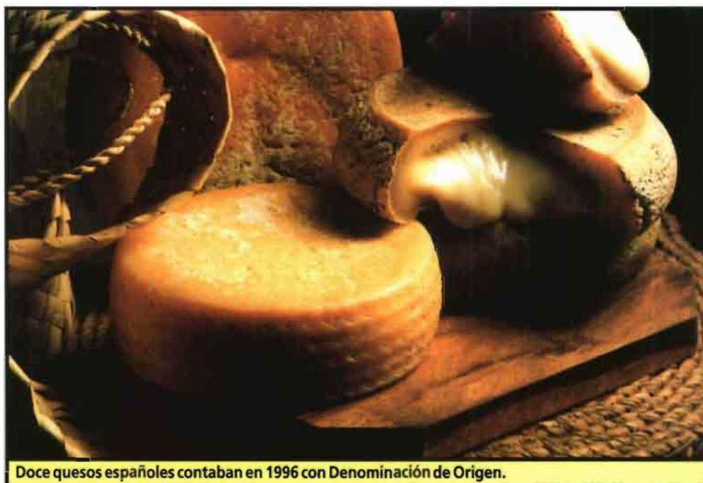
Doce quesos españoles contaban en 1996 con Denominación de Origen.

Unas 866.352 cabezas de ganado se dedicaron a la producción de quesos con