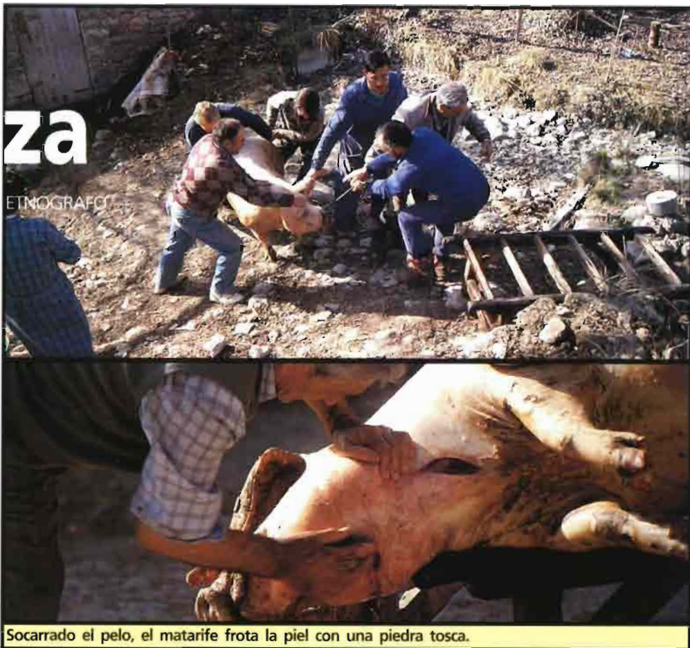
Socarrado el pelo, el matarife frota la piel con una piedra tosca.

Rajado de arriba a abajo, el matarife separa la gruesa capa de piel y manteca dejando los lomos a la vista.