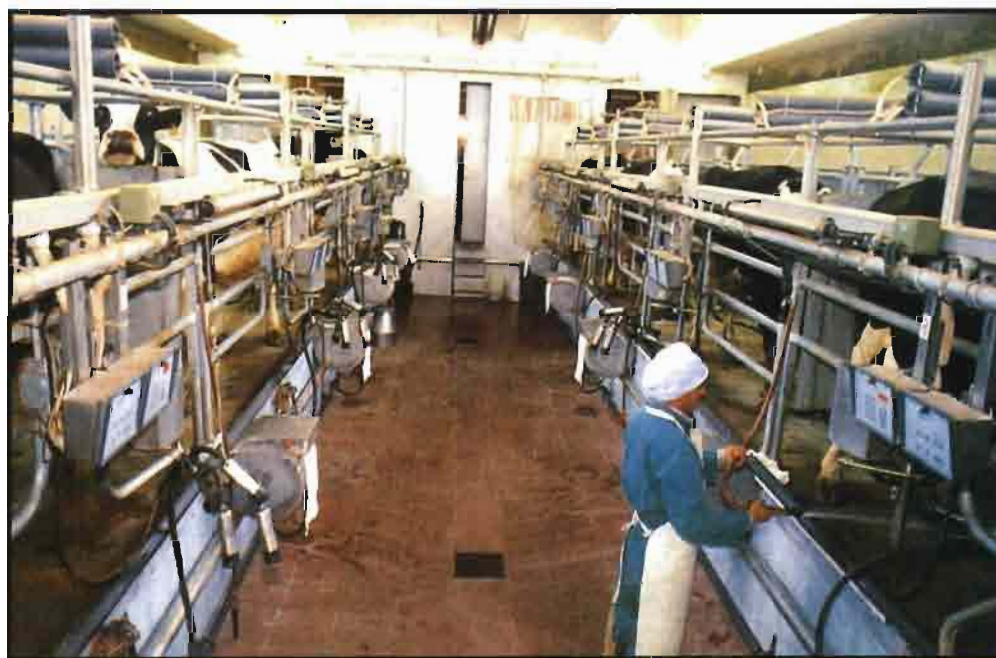
Alemania y el Reino Unido han adoptado sistemas de compensación especiales.

Última parte del trabajo donde se analiza la situación de las cuotas lácteas en el mundo, con especial incidencia en el modelo italiano, así como el futuro de las mismas.