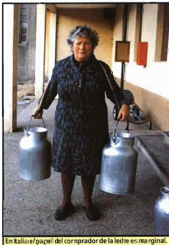
En Italia el papel del comprador de la leche es marginal.

La adopción de este procedimiento ha determinado, como se sabe, una acentuación de los desacuerdos ya existentes entre los países miembros de la