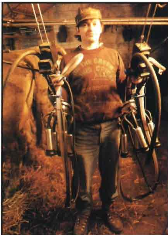
Irlanda prevé una reducción de la cuota cedida variable.

En una concepción liberal, el libre desarrollo de la oferta supone una selección de las empresas en función de su capacidad para adecuar los costes a un proceso descendente de los precios. En