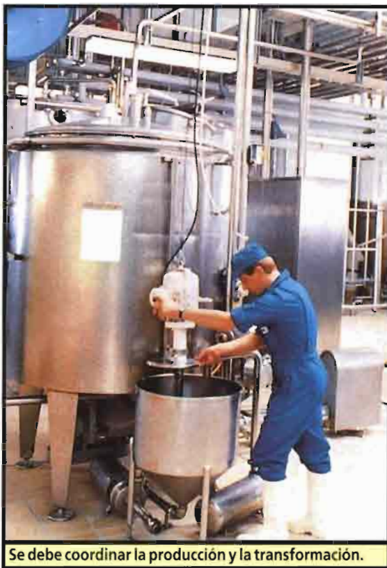
Se debe coordinar la producción y la transformación.

plejo y la definición de un precio regional estándar según las modalidades existentes no responde a las exigencias reales.