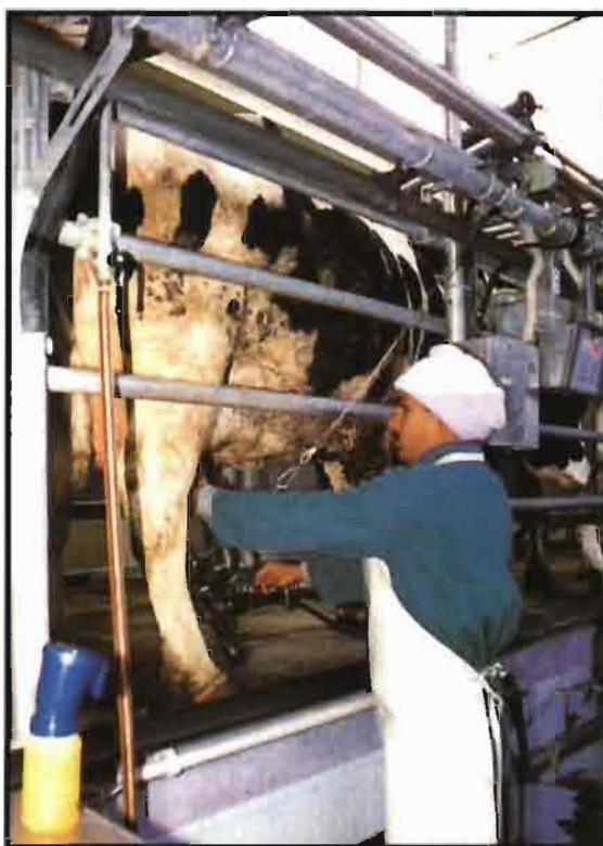
Nueva Zelanda introdujo las cuotas en 1943.

Además de las imposiciones monetarias, se aplican finalmente rebajas de la cantidad individual de referencia tanto en Suiza, donde las explotaciones de llanura experimentan una contracción de la cuota