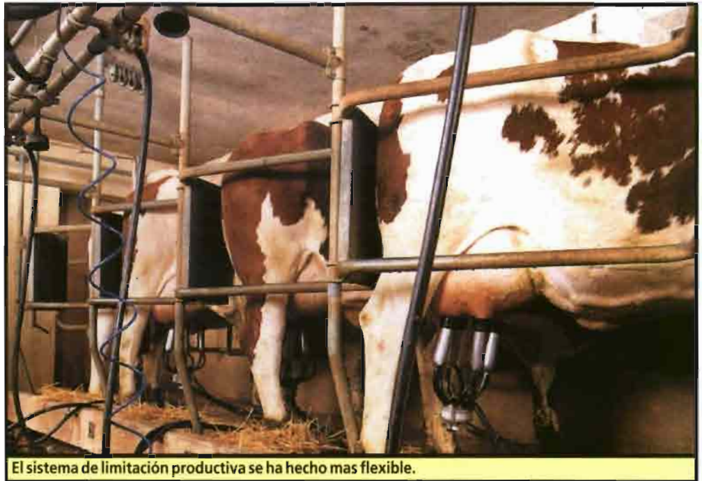
El sistema de limitación productiva se ha hecho más flexible.

Por el contrario, resultan de más remota institución en general los sistemas de control de la producción lechera adoptados en otros países del mundo. En efecto, sólo en Japón y en Sudáfrica las cuotas lácteas fueron empleadas como instrumento de contingentación a partir de una