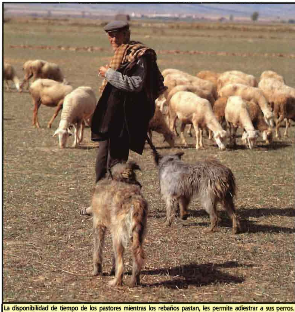
La disponibilidad de tiempo de los pastores mientras los rebaños pastan, les permite adiestrar a sus perros.

habilidades y técnicas de trabajo de estos animales se puede encontrar en los concursos de perros de ganado que se celebra anualmente en distintos puntos del Pirineo. Allí, cada pastor demuestra su buena comunicación con el perro, bien sea con señales, silbidos, ceños e incluso palabras.