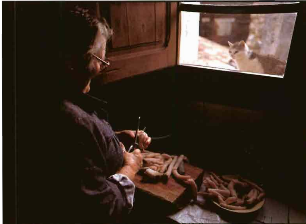
El parecido físico de las colas de las ovejas con los espárragos, hace que en muchos lugares llamen a este plato «espárragos montañeses».