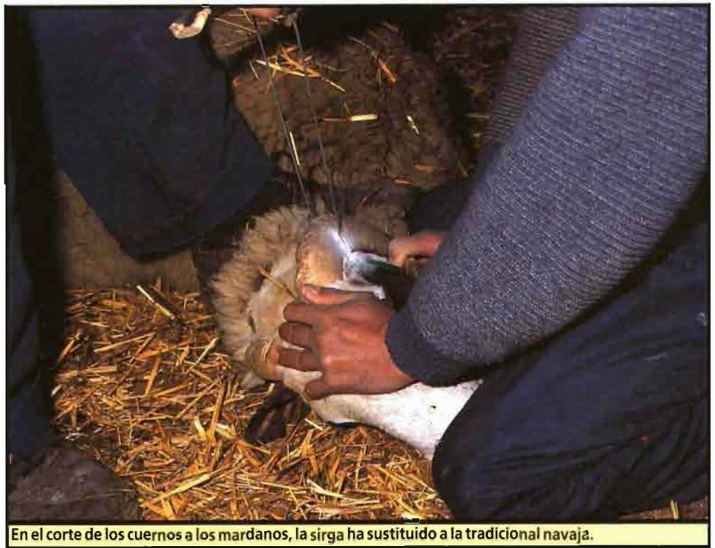
En el corte de los cuernos a los mardanos, la sirga ha sustituido a la tradicional navaja.

Al llegar a viejas las ovejas van perdiendo su dentadura empezando por las primeras piezas que les salieron. Sin dientes no pueden comer y por lo tanto mueren. Estos animales pasan a los «desviejes» -animales para carne- y se venden. Aunque lo normal es que vivan 7 años,