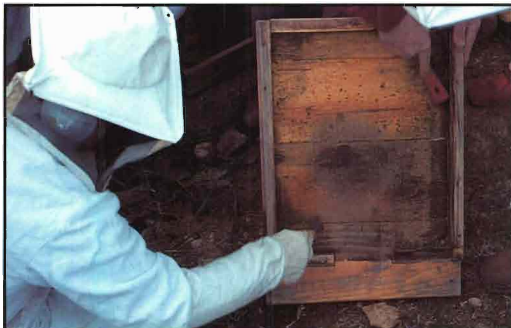
La limpieza de los fondos de las colmenas evita futuros problemas patológicos.

que se ve fuertemente favorecida por el empleo de un acaricida que puede estar alejado de las normas más idóneas para el respectivo control.