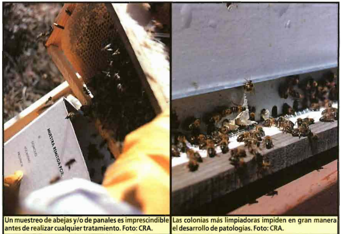
Un muestreo de abejas y/o de panales es imprescindible antes de realizar cualquier tratamiento.

Ya se indicó en su día sobre el potencial peligro que suponía la utilización de productos farmacológicos no específicos para abejas, empleados en tratamientos con aplicaciones de forma artesanal con un absoluto desconocimiento de la dosis