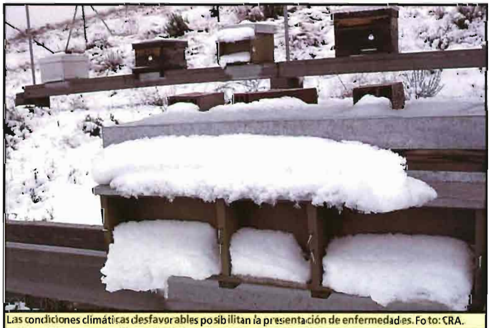
Las condiciones climáticas desfavorables posibilitan la presentación de enfermedades.

Comentábamos entonces y lo volvemos a decir ahora, que es importante el cambiar cada cierto tiempo de producto farmacológico con poder acaricida. La investigación del Centro Regional Apícola de Castilla-La Mancha, junto con otros centros, ha posibilitado el conocimiento de una serie de acaricidas que el apicultor podría utilizar, con el fin de evitar la aparición de resistencias a un producto activo,