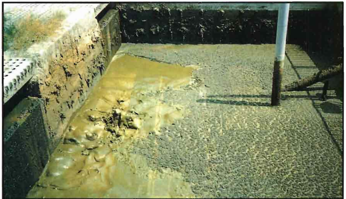
La depuración de las aguas residuales es de difícil ejecución por motivos de orden económico y práctico.

En este caso, el efecto de dilución de la carga nitrogenada con las aguas urbanas tiende a reequilibrar la relación C/N hacia valores aceptables a los fines de una ópti-