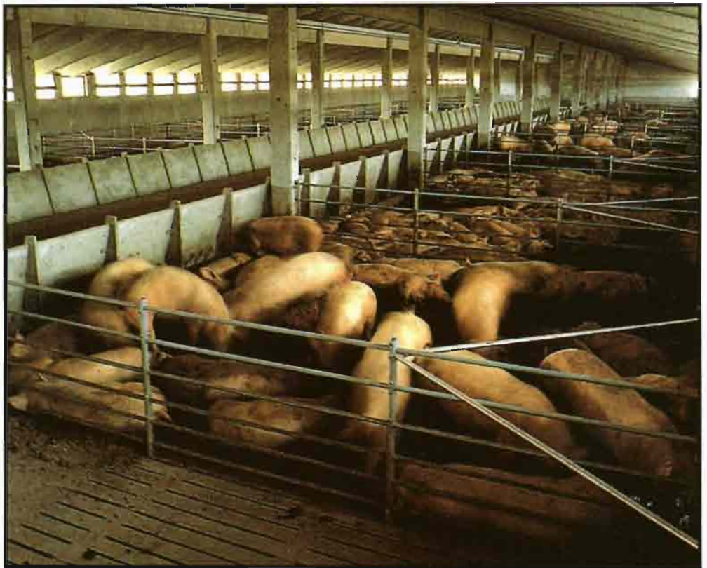
La primera emisión de amoníaco se obtiene ya en el interior de los establos, sobre los pavimentos y sobre todo en las fosas que están debajo.

El paso de la simple distribución sobre el suelo a la utilización agronómica ha im-