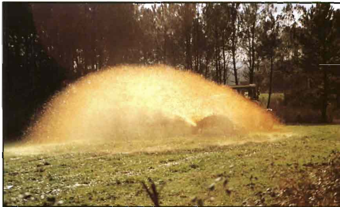
Las aguas residuales aportan materia orgánica y elementos fertilizantes a los suelos.

Cuotas más altas de amoníaco son liberadas como consecuencia de la distribución ( cuadro IV ), no tanto durante las operaciones de dispersión, como durante la permanencia en el suelo, donde, según las condiciones climáticas y las características del suelo y de los cultivos, pueden alcanzar en los 5 primeros días el 40% de la cuota distribuida (Bonazzi y Navarotto, 1991).