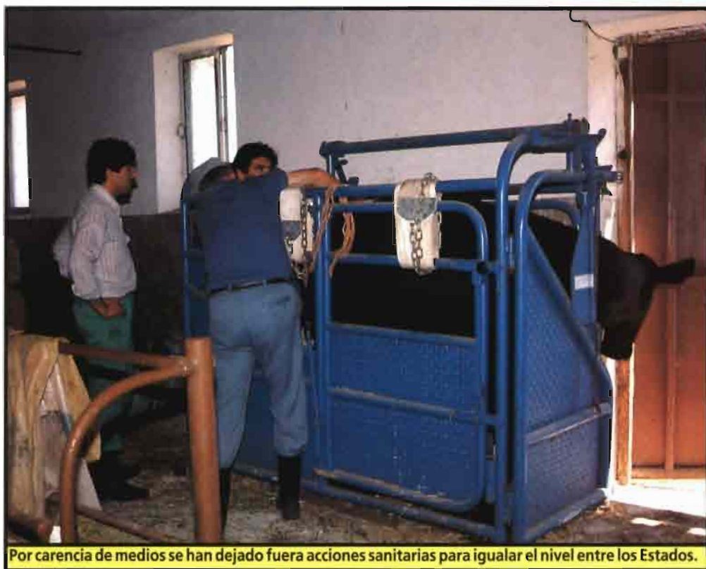
Por carencia de medios se han dejado fuera acciones sanitarias para igualar el nivel entre los Estados.

Las normas en cuestión se plantean bajo el prisma de la necesidad de aplicar medidas eficaces que eviten la propagación de una enfermedad dada y que garanticen a las distintas autoridades nacionales que dicha enfermedad se man-