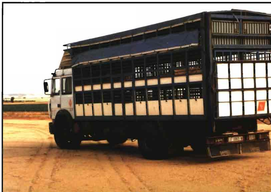
El bienestar en el transporte de animales necesitó ocho reuniones del Consejo Europeo de Agricultura.

Ante el peligro de transmisión de zoonosis y otras epizootias a través de los intercambios de los productos animales y para establecer una cierta coherencia entre los controles sanitarios efectuados sobre los animales vivos y las implicaciones económicas que acompañan a dichos controles, se han establecido las garantías sanitarias exigibles en el origen de dichos productos animales. Como norma general,