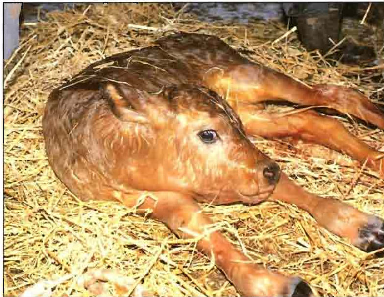
En los bóvidos las enfermedades respiratorias son más frecuentes en animales manores de un año.

De una forma general podemos distinguir entre dos tipos de patógenos, considerando como primarios a aquellos que pueden iniciar un proceso más o menos grave (desde inaparente hasta mortal), por sí mismos; mientras que los secundarios son microorganismos (la mayoría de las bacterias) capa-