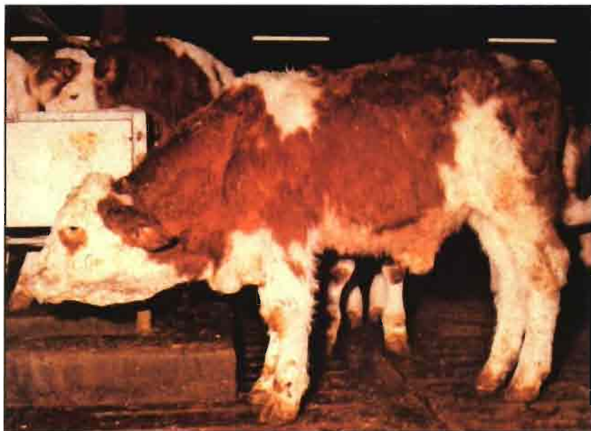
Ternero de perfil con disnea intensa, abatimiento, cabeza baja, cuello extendido, orejas caídas y boca con espuma (IBR).

rece la hipoxia o anoxia periférica, y por tanto la retención o multiplicación de los agentes infecciosos en el área lesionada.