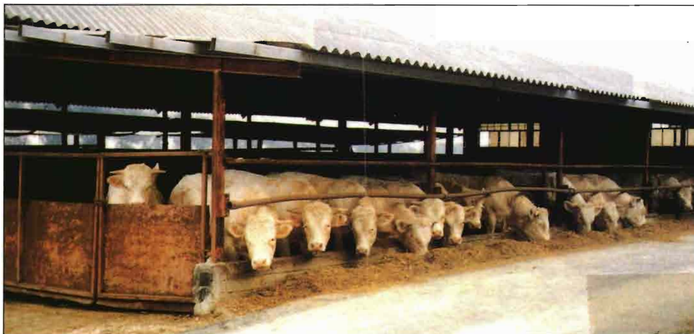
La aparición del SRB está condicionada por la confluencia de numerosos factores, tanto propios del animal como dependientes del medio ambiente y del manejo.

• También debemos considerar la inmunodepresión provocada por agentes infecciosos, tales como el virus del BVD, y la subsiguiente a la administración de fármacos como los glucocorticoides.