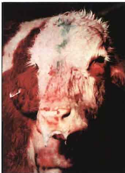
Cabeza de ternero con descarga nasal sero-mucosa (IBR).

Es un elemento de extrema importancia a tener en cuenta, tanto en el desencadenamiento, como en la evolución del Síndrome Respiratorio.