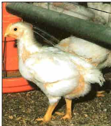
Las temperaturas de cría varían con la edad del pollito.

El pollito es un ser vivo, y como tal su organismo mantiene un estado de equilibrio (hormonal, temperatura