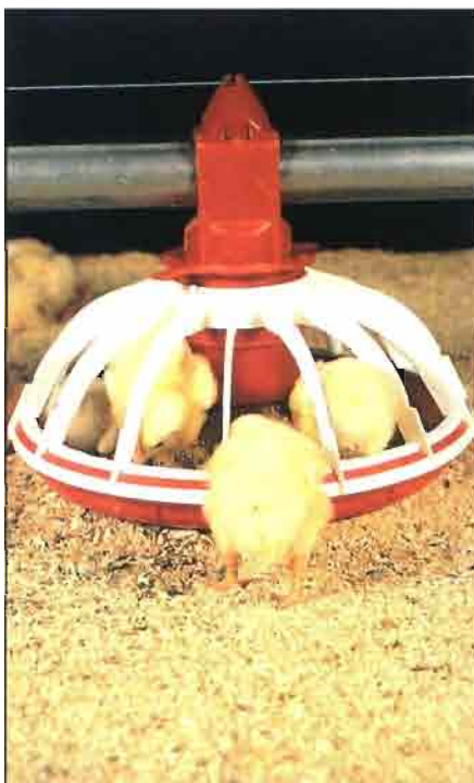
El pollito debe tener a su disposición pienso fresco y fácilmente accesible.

cesario poner a disposición de los pollitos puntos de agua suficientes desde el primer momento. Un punto de agua cada 100 pollitos.