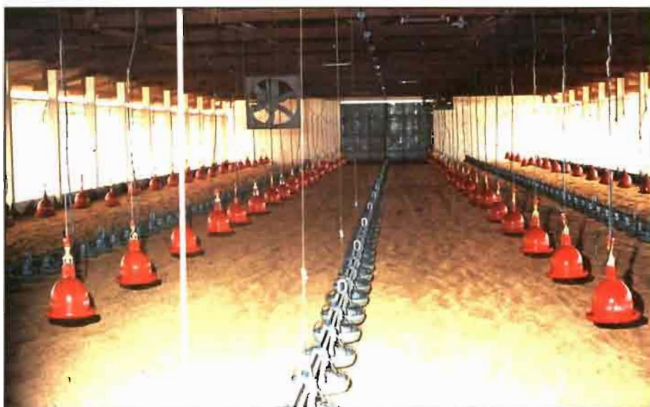
Las diferencias entre una nave tipo Louisiana y las tradicionales pueden ser más de aplicación práctica y de manejo de ventilación.

Con un intercambio pasivo del aire, el volumen total de una nave puede renovarse más de una vez por minuto,