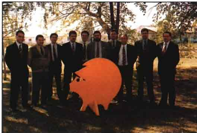
Equipo Hypor. Un conjunto de profesionales a su servicio.

Nutreco, con sede en Holanda, inició su actividad dividiendo en siete sus unidades operativas (Nanta, UFAC, Hendrix, Avicultura, Agriespecialidades, Genética y Acuicultura) en las que se reparten las 20 grandes compañías del holding que a la vez controlan las más de 60 plantas de producción y procesamiento de alimentos que conjuntamente poseen por todo el mundo. Estas veinte compañías de Nutreco facturan anualmente doscientos mil millones de pesetas y dan trabajo a unas 6.000 personas.