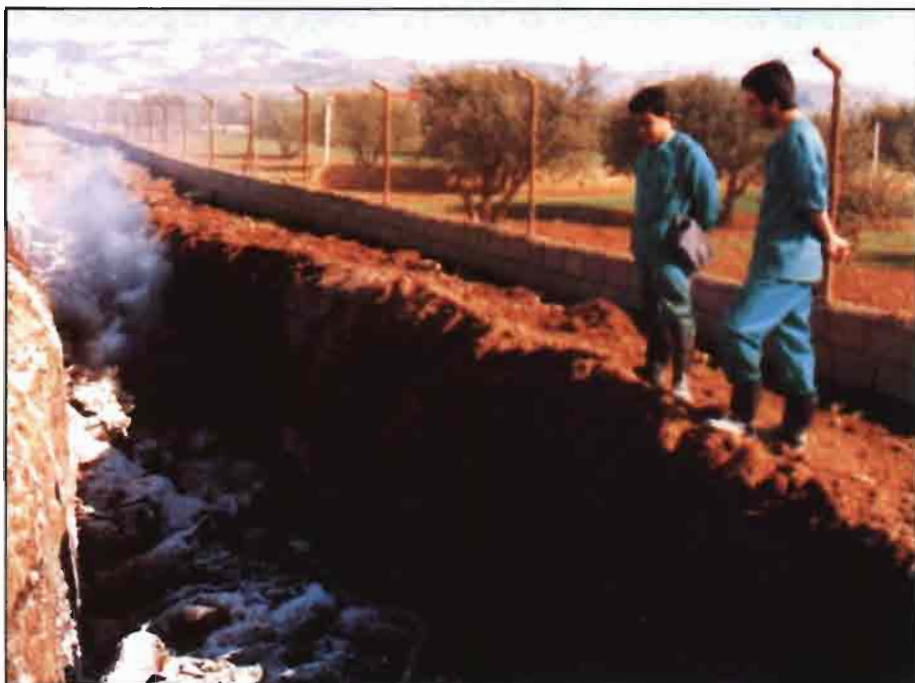
En el aspecto sanitario, las expectativas se han cumplido.