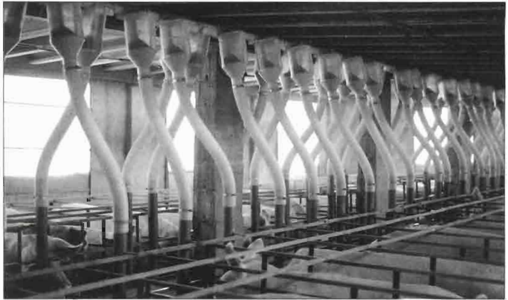
Dosificación automática de pienso en gestantes.

Plaza de engorde: con slat total: mínimo, 0,65 m 2 /c; normal, 0,75 m 2 /c.