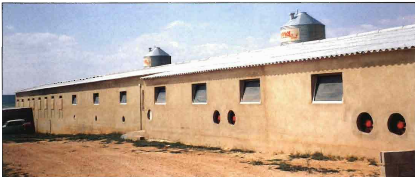
Vista exterior de nave de cerdas con capacidad para sesenta y seis animales en ciclo cerrado.

Con 50% slat: normal, 0,85 m 2 /c. Sin slat: oscila 1/1,3 m 2 /c.