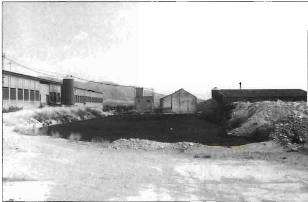
Balsa típica de almacenamiento de purines.

Dicho efluente contiene en forma asimilable por las plantas, además de nitrógeno, todos los macroelementos (cuadro II) y la mayor parte de los microelementos esenciales para la nutrición vegetal (cuadro II) no constituyendo ningún problema los elementos pesados como el cobre, cuya concentración se reduce considerablemente. El purín crudo contiene también Zn, Fe y Mn (Ferrer y col., 1981), aunque no se dispone de datos relativos a las concentraciones de los mismos en los distintos efluentes, es de suponer que estos metales pesados se acumulan en los lodos del fondo de la balsa de digestión EAZ cuyo