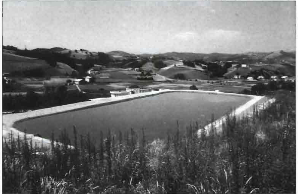
Bolsa de digestión anaerobia EAZ con tratamiento aerobio al fondo.

Dicha utilización supone un ahorro a todos los niveles, ahorro en instalaciones y costes de ejercicio y ahorro en fertilizantes. Resulta lamentable, pudiendo reutilizar los purines previamente acondicionados, consumir energía en una depu-