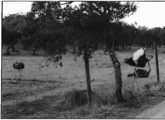
En Europa se empiezan a instalar las primeras granjas de avestruces.

En la actualidad, firmas europeas tan prestigiosas en el mundo de la moda como Christian Dior, Hermes, Gucci y otras ofrecen cinturones, botas, maletas, maletines, bolsos, carteras, cazadoras y abrigos confeccionados en la preciada piel de este ave.