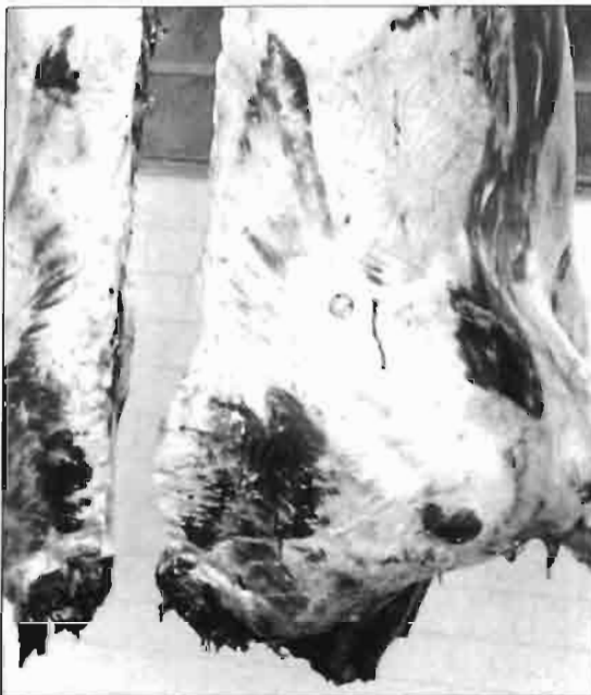
La tuberculosis bovina provoca cuantiosas pérdidas al ganadero, especialmente por decomisos de las canales.

Es bien sabido que, desde su conocimiento y diagnóstico, la tuberculosis ha sido una de las enfermedades clave en la patología del ganado bovino español. Se ha mantenido endémica hasta el momento actual, en el que ya