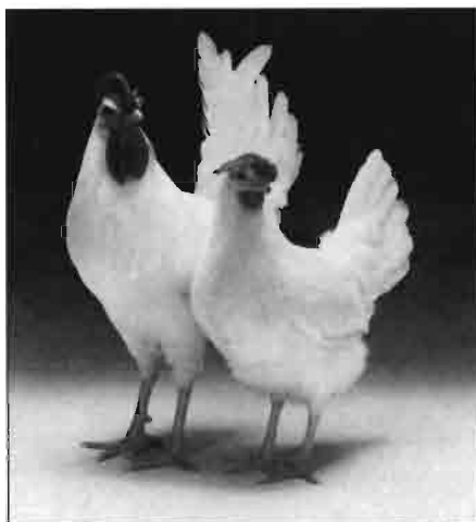
Reproductoras Lohmann LSL.

Asimismo, Lohmann comercializa reproductoras LSL con las siguientes características: edad al 50% de la producción, 22-23 semanas; pico de producción (28-32 semanas), 87-91%. Total huevos por gallina alojada a las 68 semanas de edad, 240-250; 255-265 a las 72 semanas de edad. Huevos incubables por gallina alojada a las 68 semanas de edad, 215-225; a las 72 semanas de edad, 225-235. Pollitas vendibles por gallina alojada a las 68 semanas de edad, 85-90; a las 72 semanas de edad, 90-95. Total nacimientos, 80-82%.