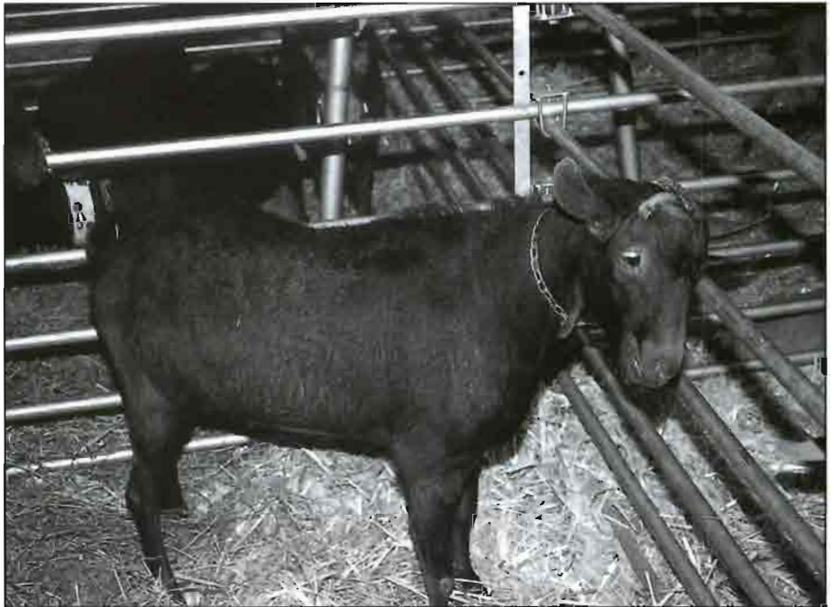
El control de rendimientos es el instrumento básico de la mejora genética.

Mejorar el rendimiento de las cabras es un elemento clave; junto con otros factores relacionados con la comercialización, para el futuro del sector. Esto se puede lograr mejorando las condiciones ambientales, pero existe siempre un límite, determinado por la capacidad genética del animal, que no se puede superar más que a través de la selección de los animales genéticamente mejores.