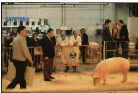
Momento del Concurso de Ganado porcino.

cia. No participó en las secciones primera y tercera.