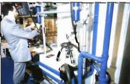
Stand de Alfa Laval Agri.

Alfa Laval Agri presentó entre sus instalaciones y accesorios para el ordeño, alimentación para el ganado, refrigeración y tratamiento de la leche, energía, tratamiento de estiércol, etc., el sistema profesional completo para ordeño, manejo y alimentación Alpro, el cual mejora la eficacia y rentabilidad gracias a una gran precisión en el registro de la producción de leche, asimis-