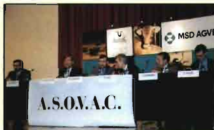
Instantánea de las Jornadas de Asovac.

En este punto Asovac recordó que ha mantenido varias reuniones con el director general de Política Alimentaria, Puxeu, para estudiar el borrador de la Ley de Interprofesión. En estas reuniones, Asovac ha insistido en que el proyecto debe garantizar que en las decisiones económicas de la interprofesión deben intervenir aquellas organizaciones capaces de acreditar un alto grado de representatividad de la