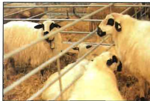
Ovejas churras en el stand del MAPA.

Granja Badiola (Asturias), se alzó con el premio al Mejor Rebaño, siendo