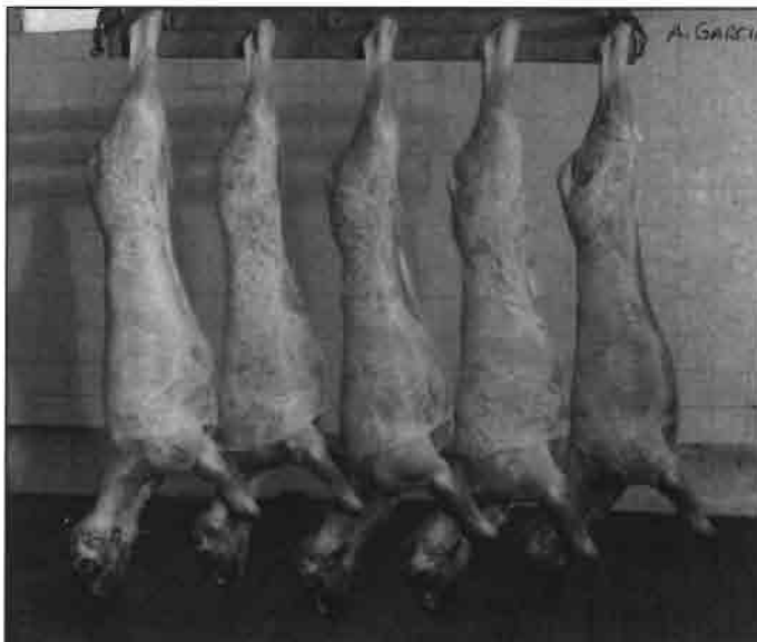
Hay que elevar el nivel sanitario de nuestra cabaña ovina.

Las repercusiones y beneficios que reportaría la Denominación de Origen o Específica que se promueve por la ANCHE y su Cooperativa COLECHU y por algunos otros ganaderos, industriales y profesionales del sector, pudiéramos resumirlas del siguiente modo: