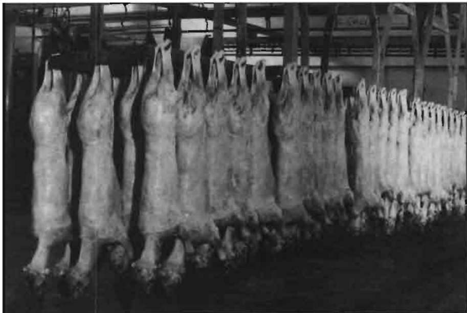
Los mataderos españoles han de mejorar para su homologación de cara al tráfico intracomunitario.

En el sector cárnico, que supone la mayor cuota económica de todo el sector alimentario español, se están empezando a obtener las primeras Denominaciones de Origen, Específicas y Marcas de Calidad. Podríamos citar las del sector del jamón curado (Teruel, Guijuelo, Jabugo), las de carnes frescas (Carne de Galicia, Carne Roxa, Carne de Avileño, Ternasco de Aragón, etc.) y avanzan lentamente algunas otras: Chorizo de Cantimpalos, Cecina de León, Botillo del Bierzo, entre otras, y