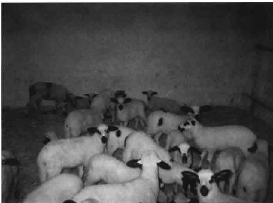
La Raza Churra debe sacrificarse de lechal independientemente de la situación de mercado.

Cuando la calidad de un producto es tradicionalmente reconocida, es necesario que sea defendido de posibles imitaciones o fraudes, y ello se consigue mediante el reconocimiento