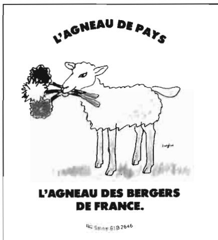
Fig. 2. Marca de calidad francesa de la carne de cordero.

– Calidad bromatológica . Vendría dada por su contenido en elementos que responden a las diferentes necesidades metabólicas del organismo, ten-