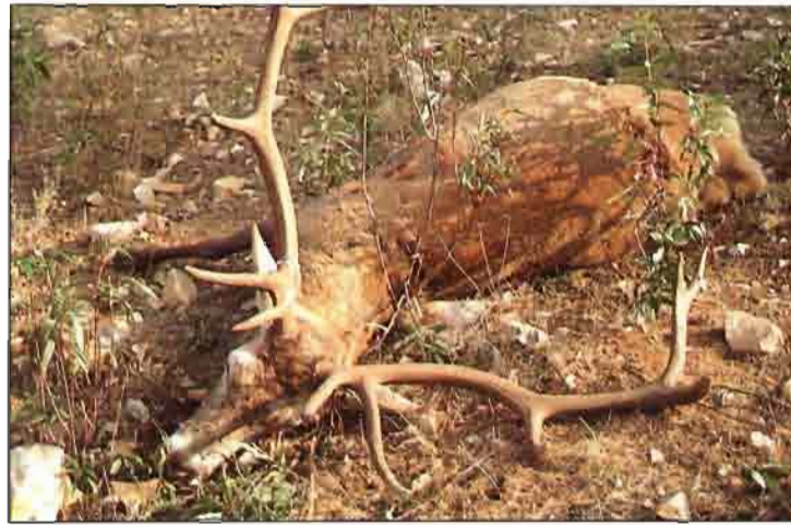
Ciervo abatido en una montería.

interferencia o impacto humano dañino y molesto para la especie.