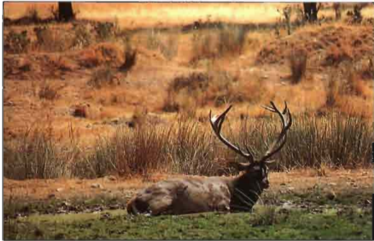
Hermoso ejemplar de ciervo en reposo.