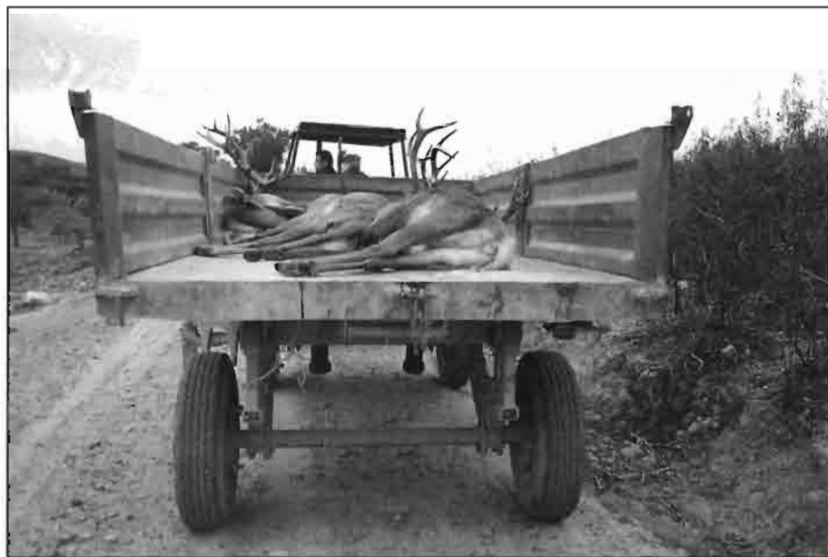
Traslado de ejemplares de ciervos abatidos en una montería.

Es muy importante suplementar en comederas concentrado, heno, alfalfa deshidratada y otras materias primas para que los ciervos durante este mes no pierdan demasiado peso. Así y todo lo pierden. Sin embargo las hembras pueden estabilizarse en cuanto a su peso. Se suministrará 1,5 UF/animal día. Es también muy importante separar al máximo las comederas en el espacio, así como ponerlas en lugares distantes de la linde. No se colocarán en caminos públicos que atraviesen fincas privadas.