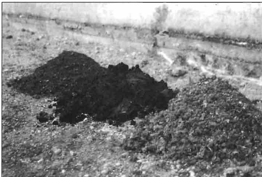
La cama de broiler es una mezcla de excretas, plumas, alimento caído y material empleado como sustrato.

bama que utilizan de forma continua cama de broiler en las raciones de su ganado (el porcentaje manejado de forma más general asciende a 15%), sin embargo se percibe un incremento actual en su uso debido a los buenos resultados obtenidos por los ganaderos que la utilizan, coste actual de los alimentos convencionales, menor rechazo por parte del público y los criadores en la aceptación de la cama como ingrediente común del ganado. Para el ganadero es fácil conseguir la cama debido a lo diseminada de la industria avícola en la zona (sistema de producción integrada donde las instalaciones y la yacija pertenecen al avicultor).