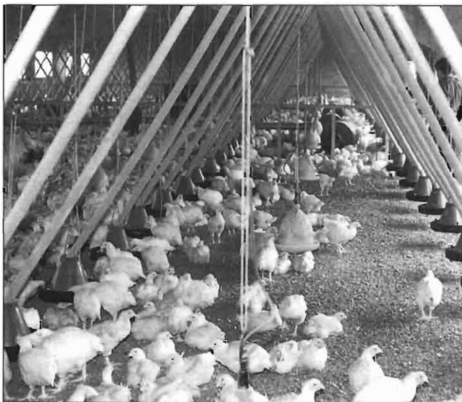
La cama de broiler es el subproducto generado por la industria avícola.

El propósito de este trabajo no es promocionar ni condenar el uso de ya-