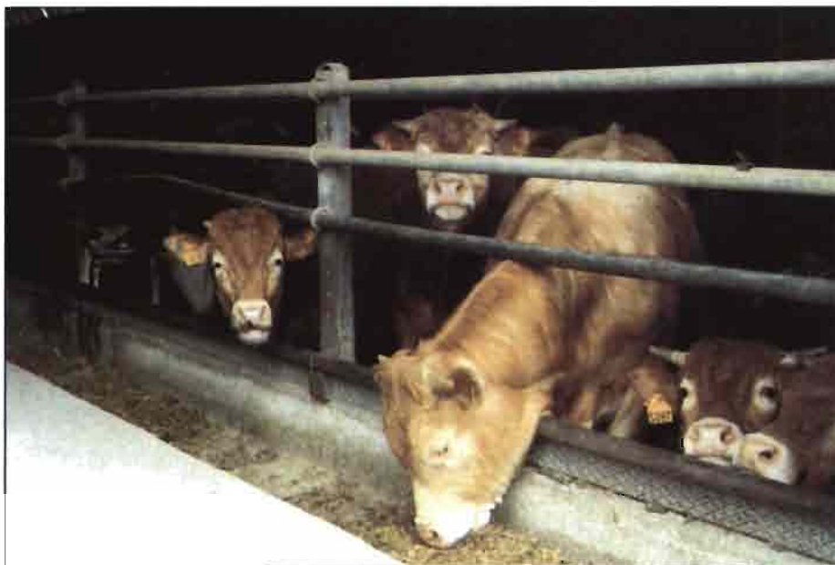
Una cama de buena calidad es económicamente más valiosa cuando se emplea en alimentación animal que cuando se utiliza como fertilizante.

— Metales pesados. El único caso documentado en la literatura consultada que evidencia efectos nocivos en el ganado alimentado con cama, se refiere a toxicidad por cobre en ovejas. Fontenot et al. , 1972a, reportaban que 64% de ovejas alimentadas con 50% de cama en la dieta durante 254 días murieron intoxicadas por cobre y 55% murieron cuando la dieta contenía 25% de yacija en la ración. Los niveles de cobre en hígado eran significativa-