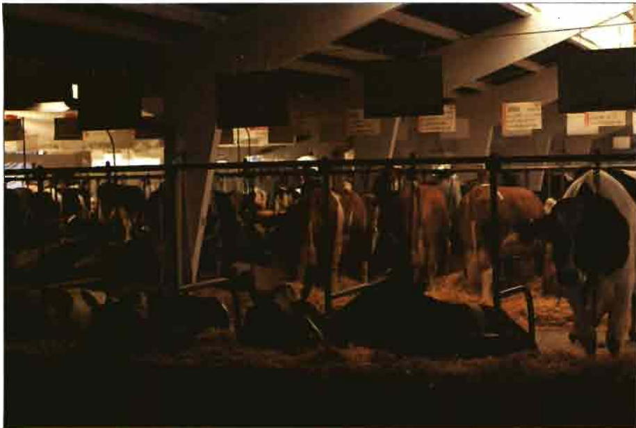
Coincidiendo con la 14.ª edición de la Semana Verde de Galicia, se celebraron en Silleda las 3.ª jornadas de las lonjas españolas.

( corderos para carne, machos o hembras, de menos de 12 meses, con un peso canal comprendido entre 12 y 3 kg y canales de dichos corderos ), y Corderos II ( corderos para carne, machos o hembras, de menos de 12 meses, con un peso canal comprendido entre 13,1 y 16 kg y canales de dichos corderos ).