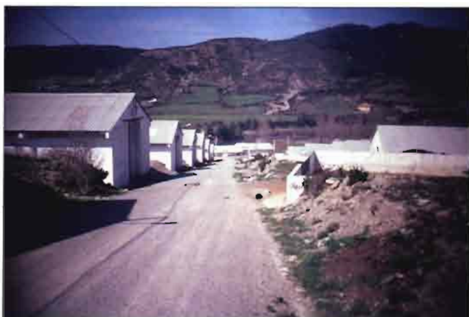
Fig. 3. Vista general del POLIGONO GANADERO de Hecho (Huesca), tomada desde el lado opuesto del río.