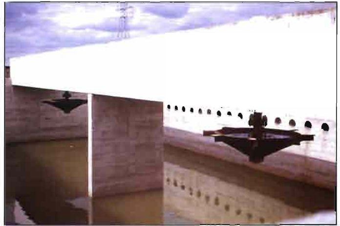
Fig. 7. Aspecto de la planta depuradora de aguas residuales del POLIGONO GANADERO de Cascón de la Nava (Palencia), en desuso.

ganado. Las subvenciones fueron importantes y las cantidades anticipadas como créditos, pagaderas en plazos muy largos, con bajos intereses. Además, como se señala más arriba, la fuente de ingresos de esas localidades ha sufrido tan radical transformación, que las explotaciones ganaderas han dejado de ser prioritarias y hoy son un simple complemento en la actividad de sus propietarios.