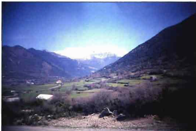
Fig. 1. Vista del Valle de Hecho (Huesca) desde el POLIGONO GANADERO.

dades, como Madrid, por ejemplo. En algunos lugares se ofreció a sus propietarios, en compensación a la supresión de cuadras ciudadanas, terrenos urbanizados donde levantar las nuevas granjas que sirvieran de albergue a los animales expulsados de la ciudad. Algunos aceptaron el ofrecimiento, pero la mayoría liquidaron sus ganados y cambiaron de actividad.