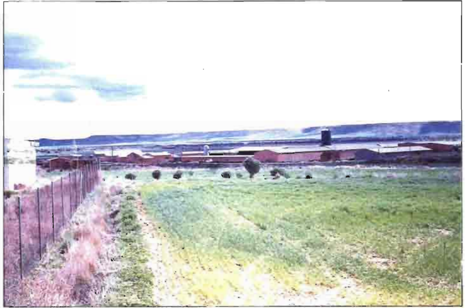
Fig. 5. Vista general del POLIGONO GANADERO de Cascón de la Nava (Palencia).

Otra modalidad de POLIGONO GANADERO es el que aquí se designa co-