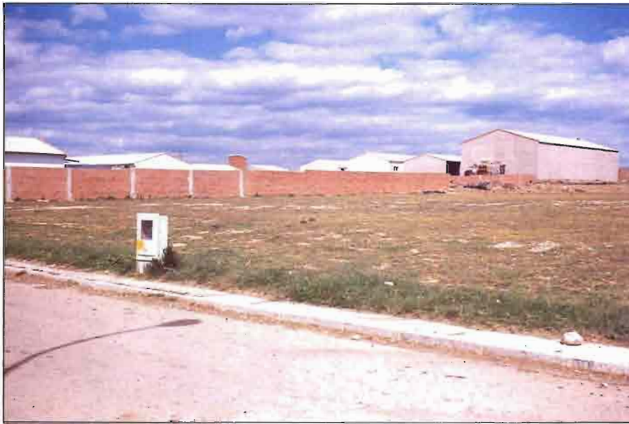
Fig. 8. Parcela del POLIGONO GANADERO de Cascón de la Nava con su armario para contadores.

dactados por este autor, siendo las condiciones de financiación previstas tan ventajosas como las de Hecho. Pero en el momento de tener que responsabilizarse los ganaderos de la deuda a contraer, prefirieron no continuar adelante, por lo que dichos POLIGONOS no se construyeron.