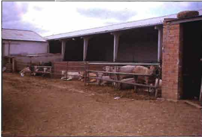
Fig. 6. Una explotación de vacuno en el POLIGONO GANADERO de Cascón de la Nava (Palencia).