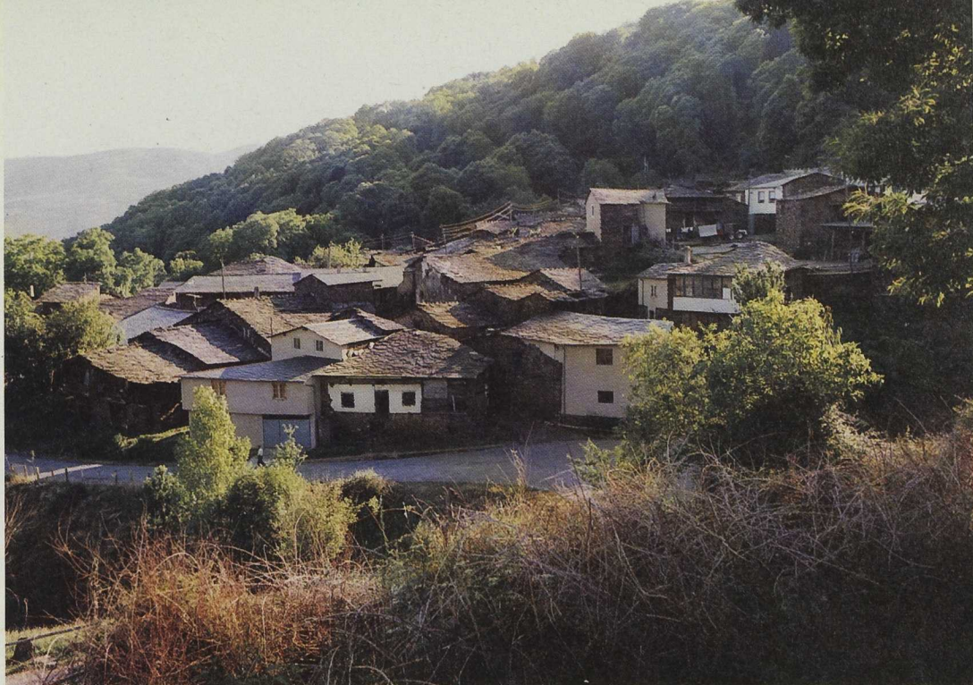
Las aldeas han sido seleccionadas por sus valores etnográficos, históricos y paisajísticos. Aldea de Seceda, Folgoso de Caurel.

proyecto, orientados a la rehabilitación integral de núcleos rurales, la Asociación estableció la necesidad de que las respuestas positivas de los propietarios para acogerse al Plan representaran al menos un 70-80% de la totalidad o que, en su defecto, pudiera actuarse sobre barrios enteros dentro de una misma aldea.