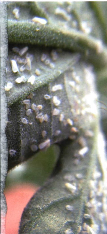
Huevo de nemátodo en proceso de lisis de tejidos a causa de enzimas fúngicas.

secreción de enzimas y toxinas capaces de lisar tejidos con gran especificidad y obtener moléculas simples que si son capaces de absorber y metabolizar.