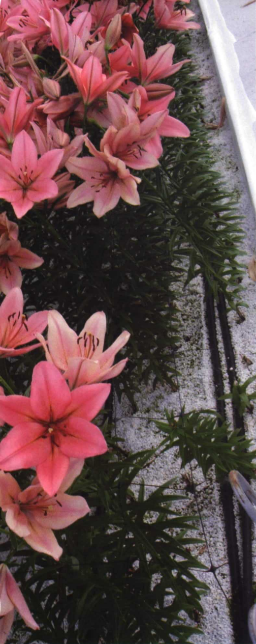
Banquetas con lilium en ensayos de control de clima.

tinental como el de Madrid; y con el grupo AN, que lo hará para cultivos hortícolas, fundamentalmente de hoja, en la zona del valle del Ebro, en Navarra.