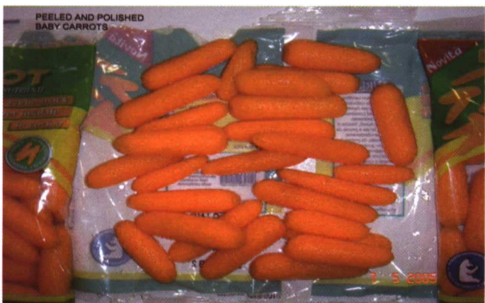
Proceso con zanahoria Imperator, desde el producto entero hasta su acabado como zanahoria baby.

A las formas tradicionales de consumo de la zanahoria, en fresco, encurtidos, congelados, se han sumado en las últimas décadas las formas mínimamente procesadas, que se presentan solas o en mezclas (rayadas, rodajas, etc.) y los preparados para consumir como snack, zanahorias baby o en forma de bastoncitos.