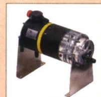
INYECTORES HIDRAULICOS FERTIC® Caudal :25/500l/h Presion: 1/12bar