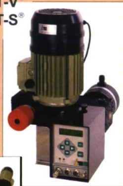
CONTROLLER'2000® COMPACT-V® COMPACT-S®