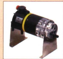
INYECTORES HIDRAULICOS FERTIC® Caudal :25/500l/h Presion: 1/12bar