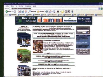
Canal Revistas on-line de la Plataforma Horticom

Adjuntar notas y comentarios, hacer correcciones, crear formularios, imprimir en cualquier impresora, incluir firma electrónica, añadir audio, vídeo y fotos..., son algunas de las ventajas que permite el formato PDF.