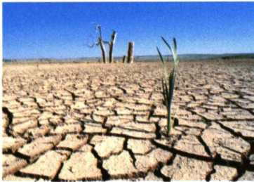
Arriba, equipo de desalación de caudal elevado. La sequía es una realidad. De ahí la necesidad de buscar nuevas alternativas de aprovechamiento de los recursos hídricos.

En la actualidad el 23% del agua que se desala en España se destina a usos agrícolas, lo que nos convierte en la primera potencia mundial en este sector.