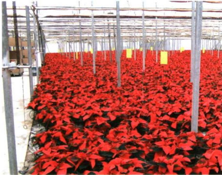
Cultivo de poinsettias en Andalucía.