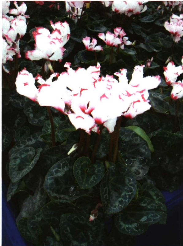
Victoria Top, de flor crestada y bicolor; se caracteriza porque el crestado aparece en el 100% de las flores.

Los productores más pequeños venden directamente al consumidor, lo que les permite obtener unos mejores precios. El grupo