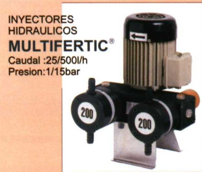
INYECTORES HIDRAULICOS MULTIFERTIC® Caudal :25/500l/h Presion:1/15bar

CONTROLADORES DE FERTIRRIGACION CONTROL PROPORCIONAL, PH, EC CONTROLLER'2000® COMPACT-V® COMPACT-S®