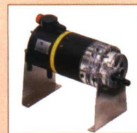
INYECTORES HIDRAULICOS FERTIC® Caudal :25/500l/h Presion: 1/12bar