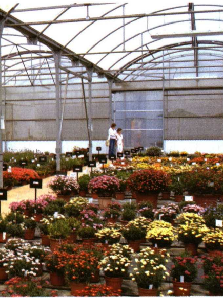
Exposición de variedades del Pla Internacional.