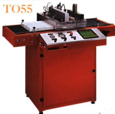
Línea de repicado LR