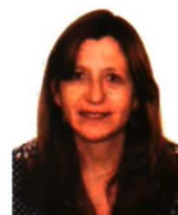
Nueva colaboradora en la sección de Lucha Integrada.

Para muchos especialistas, el reto para la investigación y para la empresa privada está en sustentar el desarrollo agrícola en un manejo racional de las estrategias de control. Para nosotros como editorial, nuestro compromiso es seguir proveyendo de información de calidad sobre esta práctica.