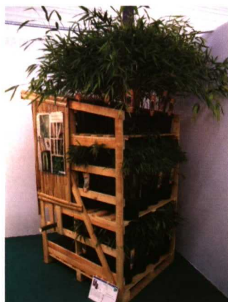
Algunas novedades pensadas para el distribuidor son las que se muestran en las fotografías: Muglino, Box Topiary y Bambox.

efectivamente, vale la pena. Habiendo encontrado allí algunas nuevas perspectivas muy interesantes, señala que "ha sido muy importante estar allí y encontrarse con nuestros clientes franceses. Además, hemos tenido la oportunidad de encontrar otros clientes y clientes potenciales de otros países".