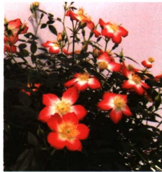
Coleus canina variegata 'Sumcom' y Rosa 'Star Profusion' (sobre estas líneas) son dos de las novedades ornamentales presentadas en el Salon du Vegetal 2007, así como 'Impatiens Divine' y Hydrangea 'Vanille' (debajo).