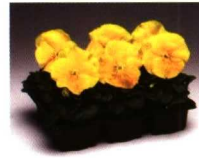
Planta joven en alveolos de la viola Colossus Yellow.

Podredumbres del cuello y de la raíz - Phytophthora spp. , Pythium spp. Síntomas: las hojas inferiores adquieren una coloración azulada o amarillean; la parte basal de los tallos es blanda y la