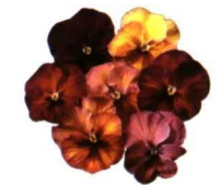
Sobre estas líneas, viola Delta y Delta Persian, de S&G.

Las intervenciones para controlar el tamaño de las plantas de viola pueden hacerse también sobre las plantas germinadas en bandejas en el momento del desarrollo de la primera hoja verdadera, utilizando una concentración más baja