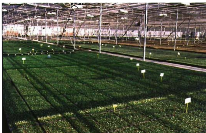
Panorámica y vista interior de la empresa.

El Grupo Padana es actualmente el líder en el sector de la floricultura italiana gracias a los elevados estándares de calidad de sus plantas y a la amplia variedad de su catálogo, con más de 1.100 referencias, entre las que se encuentran geranios anuales y bienales, rosas, plantas de interior, impatiens, ciclámenes, perennes, poinsetia, violetas, aromáticas, plantas de invierno y plantas de huerta.