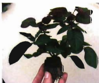
Plantones preparados para la venta, bandeja en producción y plantón de rosa.

cliente un excelente resultado. Asimismo, parte del éxito del Grupo se cimenta en la fuerte sinergia que mantiene con sus partners, como por ejemplo con los hibridadores, como Meilland para rosas, Pac para