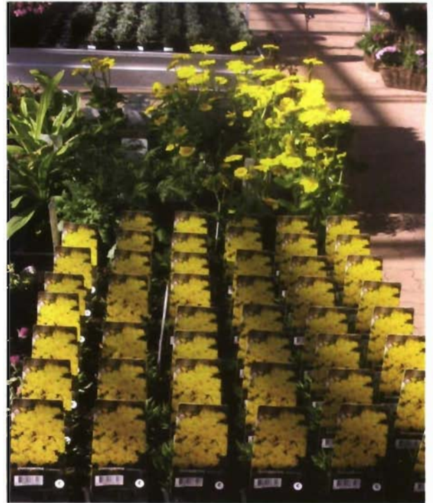
Etiquetado de plantas perennes preparadas para su comercialización en el punto de venta.

Hemerocallis se puede utilizar también como planta solitaria en el césped. Además existen cultivares que se pueden utilizar bien para rellenar espacios o alrededor de árboles y arbustos en jardines de bajo mantenimiento. Una de