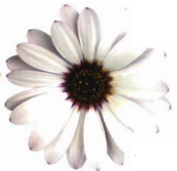
Sunny® Felix: blanca con ojo azul