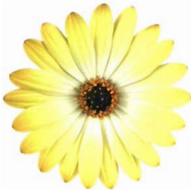
Sunny® Amanda: amarilla con aro blanco