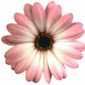
Cape Daisy® Zanzibar Pink Bicolor: rosa con aro blanco