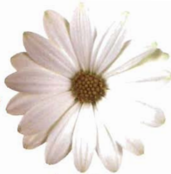
Sunny® Henry: blanca con ojo amarillo