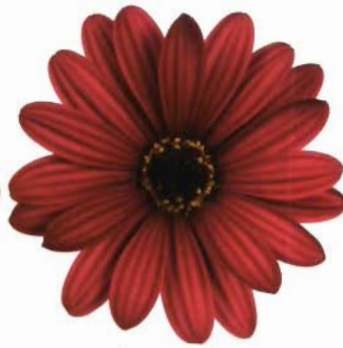
Sunny® Mary: púrpura oscura