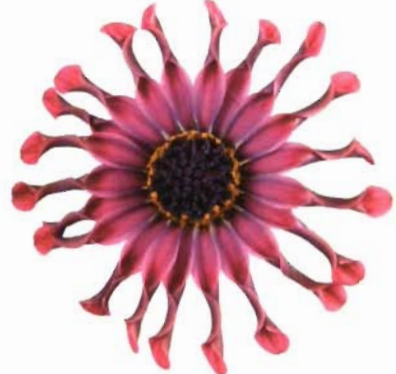
Sunny® Zara: tipo "spoon", morada

La gran tendencia del mercado ornamental actual es la búsqueda de variedades que puedan facilitar el trabajo de los productores de planta acabada y que contemplen las preferencias del consumidor final.