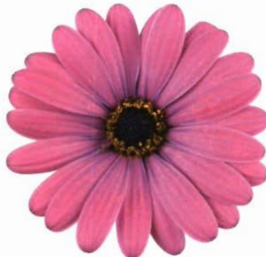
Cape Daisy® Kalanga Lavender: malva