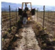
Riego por goteo BAJO SUPERFICIE GEODRIP: Tecnología ROOTGUARD