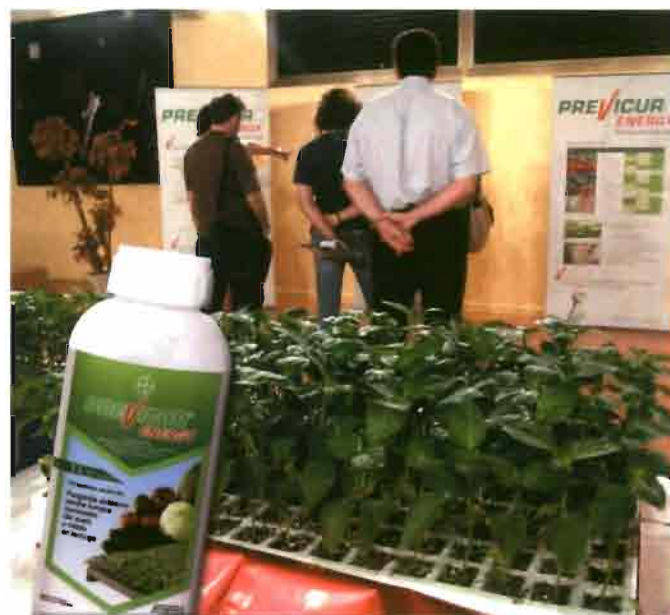
Vista general de la presentación de Previcur Energy® realizada en el Hotel Portomagno en Aguadulce, Almería.

Pol. Ind. San Nicolás - C/Francisco de Goya, s/n 04740 LA MOJONERA (Almería) Móvil: 661 327 299